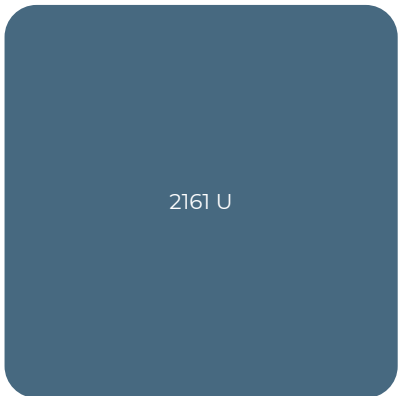
19 AZUL OSCURO